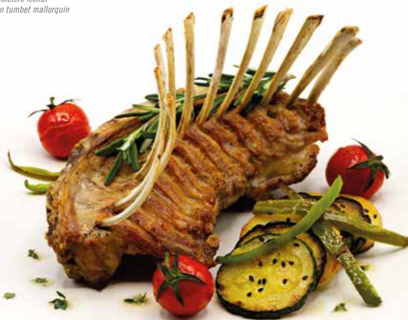
Chuletero lechal con tumbet mallorquín