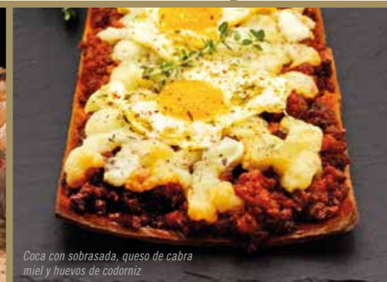
Coca con sobrasada, queso de cabra miel y huevos de codorniz