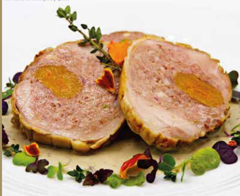
Poupieta de pollo rellena con salsa de berenjena y queso